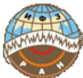
Институт физики Земли им. О.Ю.Шмидта РАН

Публикация материалов конференции осуществлялась при финансовой помощи